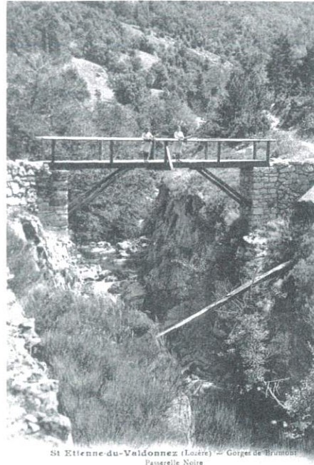
La passerelle de Bassy vers 1910