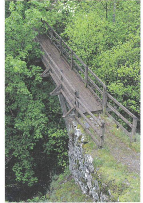
La passerelle de Bassy aujourd'hui

Au sortir des gorges, l'espace s'élargit un peu sur le côté est entre Saint-Étienne-du-Valdonnez et la première falaise du Truc de Balduc, le temps de recevoir le Valat de Merdaric. Entre le cause de Sauveterre et le Truc de Balduc, la vallée se resserre à nouveau avant de déboucher sur la petite plaine de Rouffiac puis de se resserrer encore entre le cause de Sauveterre et celui de Mende, dernière étape avant de se jeter dans le Lot en aval de Balsièges au sud de Bec de Jeu. Rien que personne ne connaisse sur la géographie de la vallée donc.