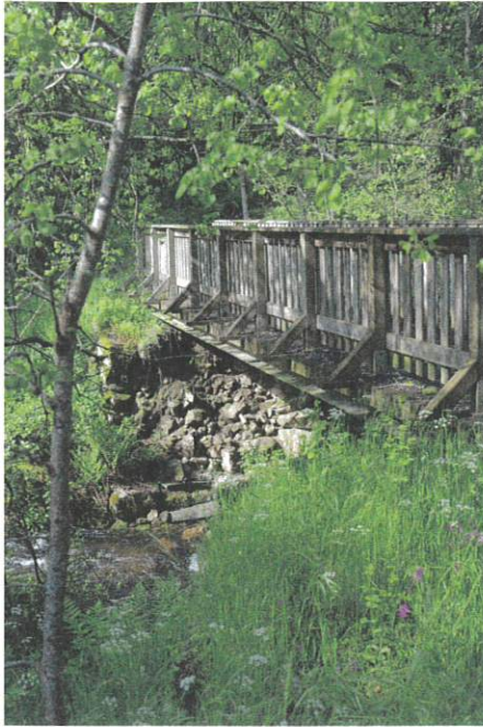
La passerelle de la Fage